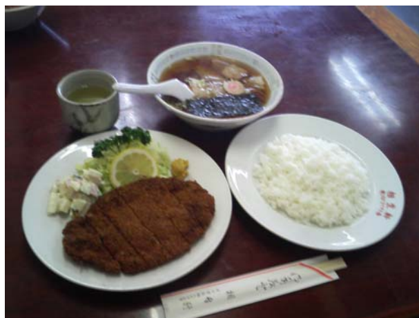
「カツライス」と「ワンタン」

来店お待ちしております。また、出前注文も行っておりますので、お気軽にお電話ください。定休日は毎週月曜日です。