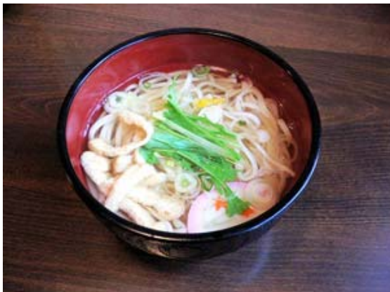
店長一押し「五島うどん」