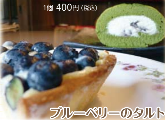
ブルーベリーのタルト 1個 400円(税込)