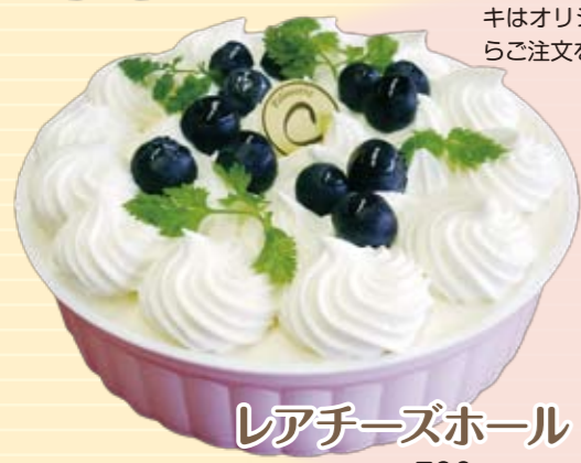
レアチーズホール 1ホール 780円(税込)