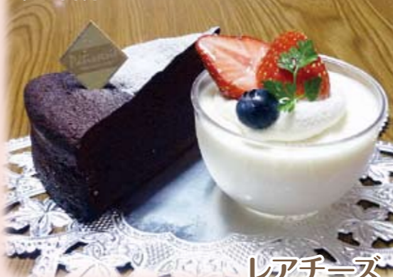
レアチーズ 1個 290円(税込)