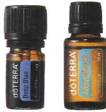
ディープブルー アロマタッチ