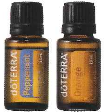
ペパーミント オレンジ