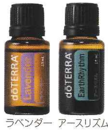
ラベンダー アースリズム