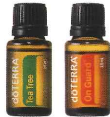
ティーツリー オンガード