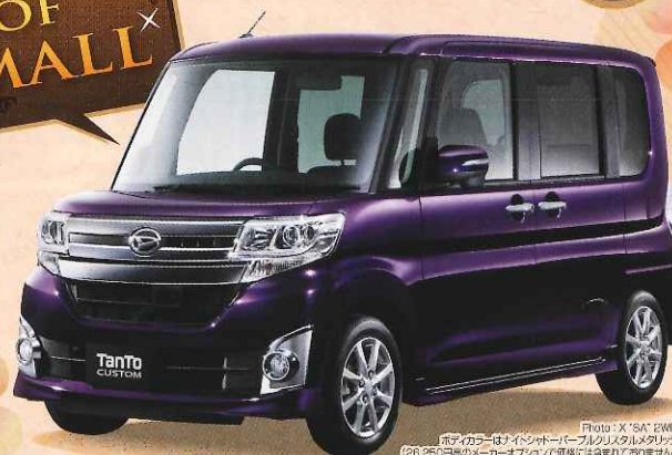
Photo: X "SA" 2WD, ボディカラーはナイトシャドウ(パールメタリック、2016年5月以降のメーカーオプションで標準では含まれておりません。)

eco LEAVE (アイドリングストップ) スマアシ 100% 免税 CVT 低燃費 28.0 km/ℓ (JC08モード)