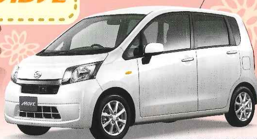
Photo: X "SA" 2WD, ボディカラーはパールホワイト、(21,000円迄のメーカーオプションで価格では含まれておりません。)

eco LEAVE (アイドリングストップ) スマアシ 100% 免税 CVT 低燃費 29.0 km/ℓ (JC08モード)